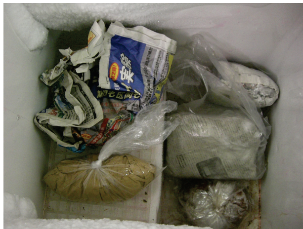
図4. 冷凍庫内に放置された動物検体

技術職員が配置される以前は実習室を統一管理することがなかったため、退官や異動で離職した教員の試薬・機器等は処分・整備されないまま放置されていた。多数の人が出入りする実習室の物品は責任の所在がはっきりしないことが多く、管理があいまいになりやすい。今後も必要なものについては、管理者を配置し、実習室の保守・管理を徹底していく。