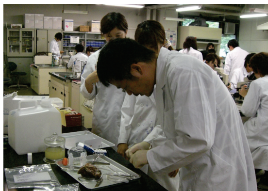
図 2.実習中の業務風景