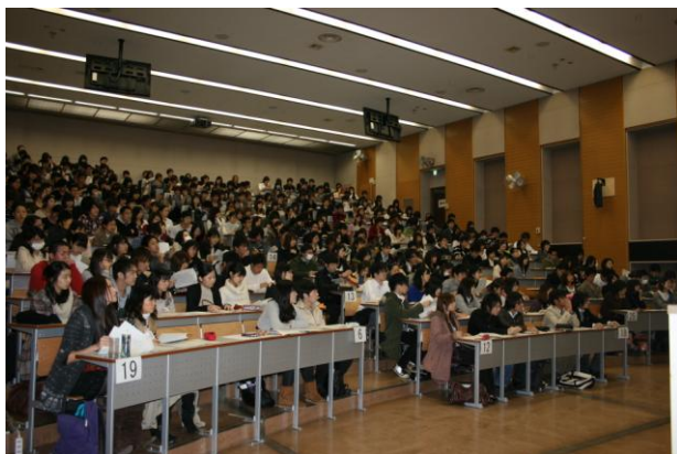
図1. オリエンテーション 2010年度

以下に履修内容について示す。 ＜オリエンテーション＞演習の目的、スケジュール、討論の仕方、評価等についてコーディネーターが説明する。(図1)