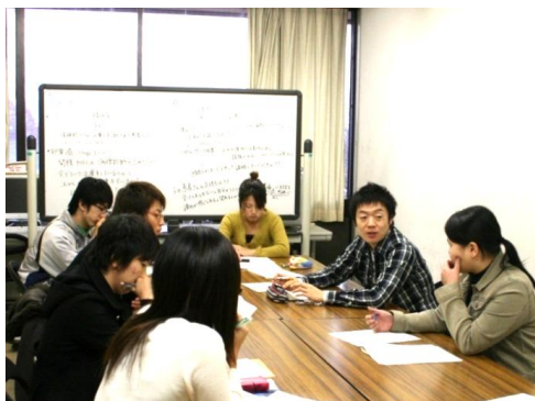
図2. グループ学習 2007年度

＜質問タイム＞「シナリオ作成者」が、自作のシナリオを使用する班を巡回し、学生からの質問に回答する。学生はシナリオを検討する際に、必要な「ケースに関する情報」を質問項目としてまとめた上で質問タイムに臨む。