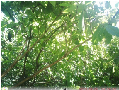
図 12. オオルリ