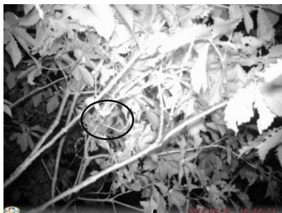
図 11. ヤマネ