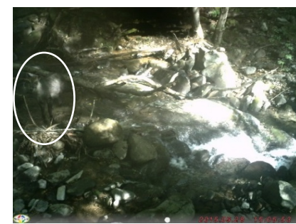
図 9. カモシカ