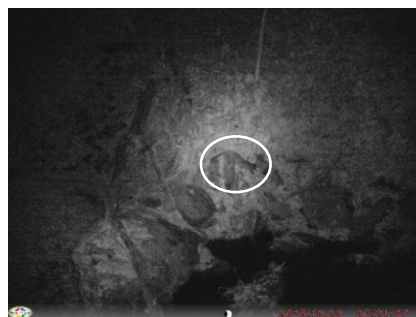
図 5. ハクビシン