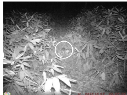
図 6. ノネコ