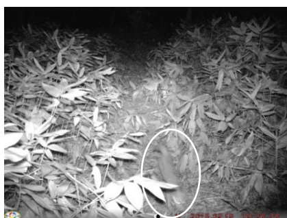
図 4. テン