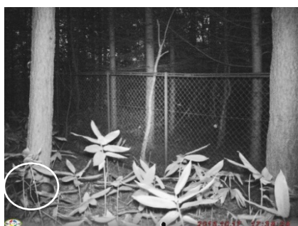
図 3. タヌキ