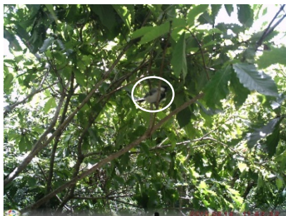
図 14. シジュウカラ