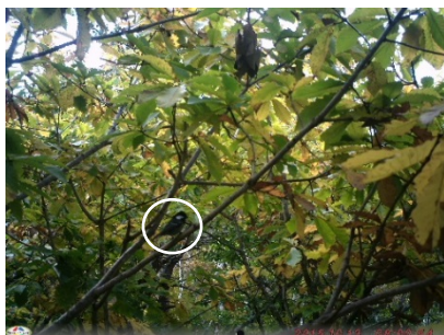
図 13. ヒガラ