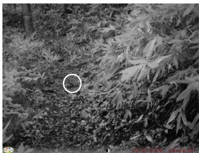
図 10. ニホンシリス