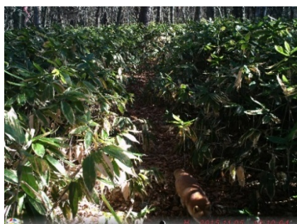
図 2. キツネ

どちらのカメラでも、日中に連続して複数枚の写真が撮影されていた。これは、陽射しで暖められた植物に赤外線センサーが反応したものと考えられた。