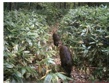
図 7. イノシシ